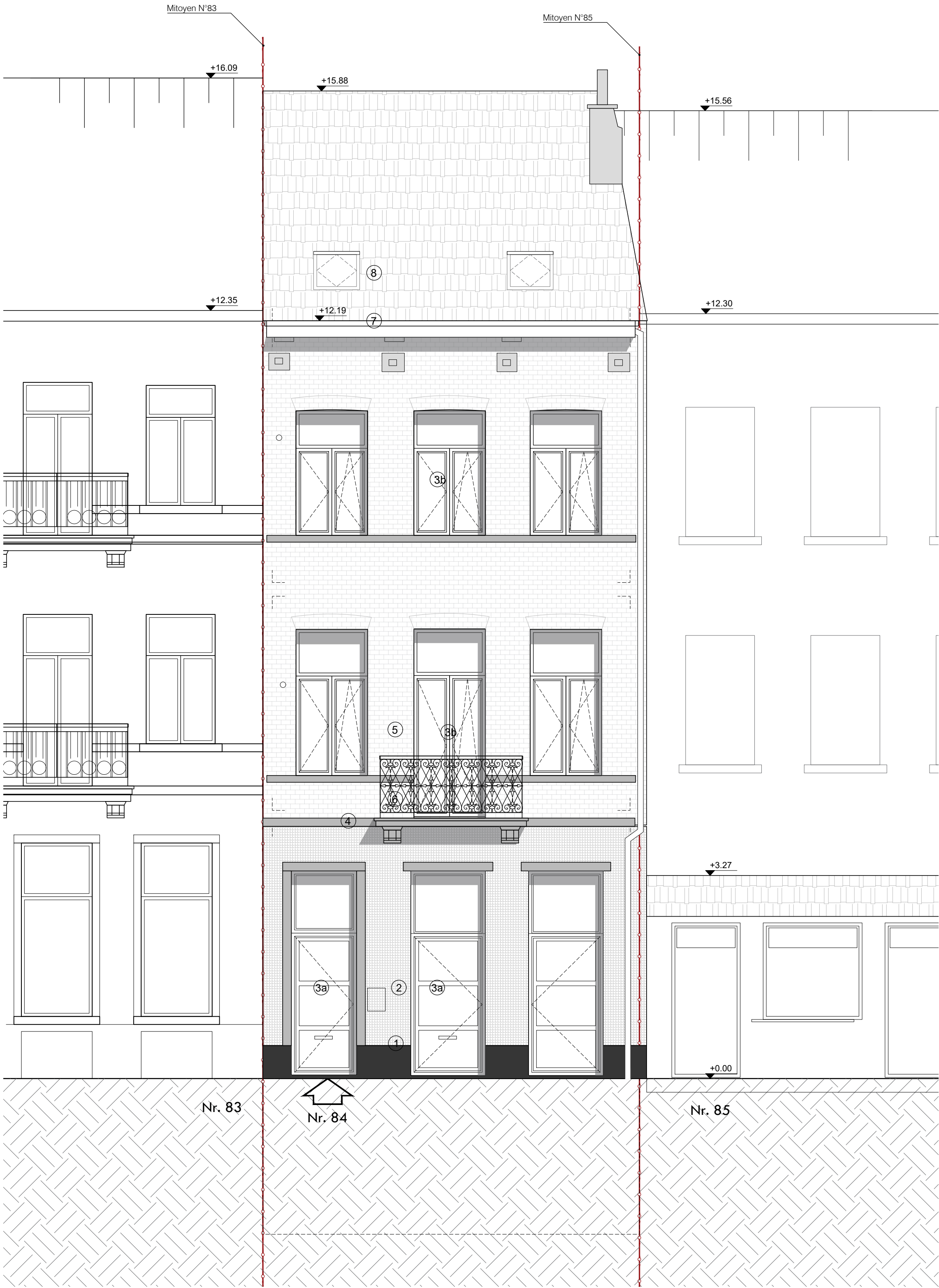
FAÇADE AVANT Ech: 1:50